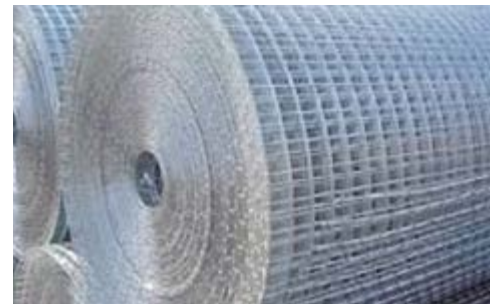
Rollos de 25 metros